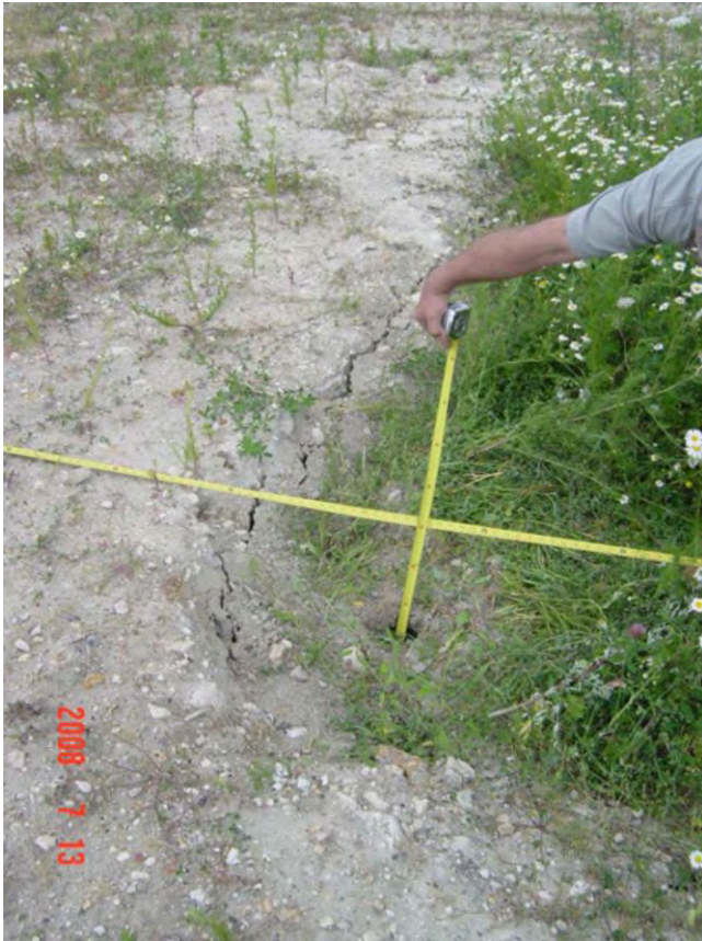
Mesure de la profondeur sur l'axe est ouest