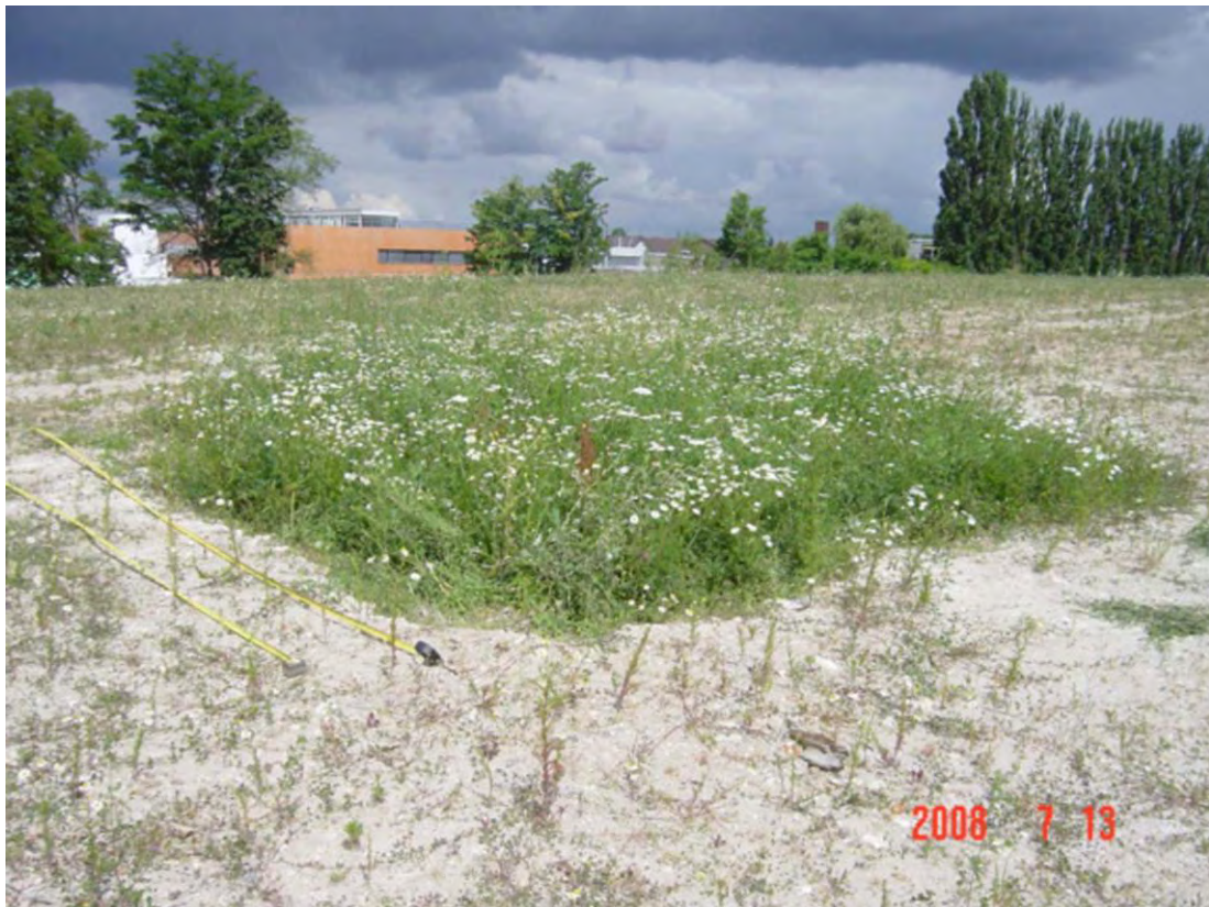
Vue face au nouveau collège