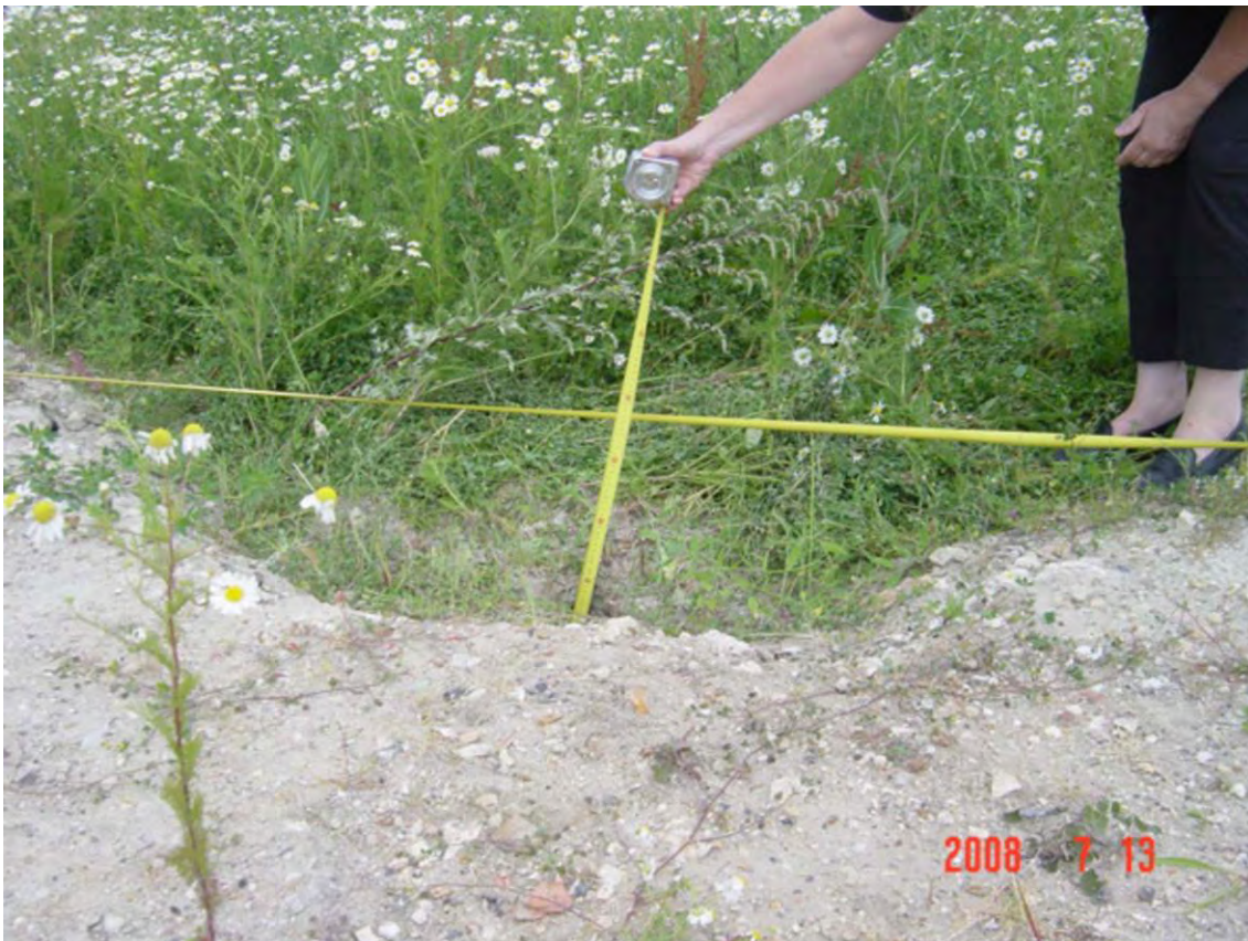
Mesure de la profondeur sur l'axe nord sud