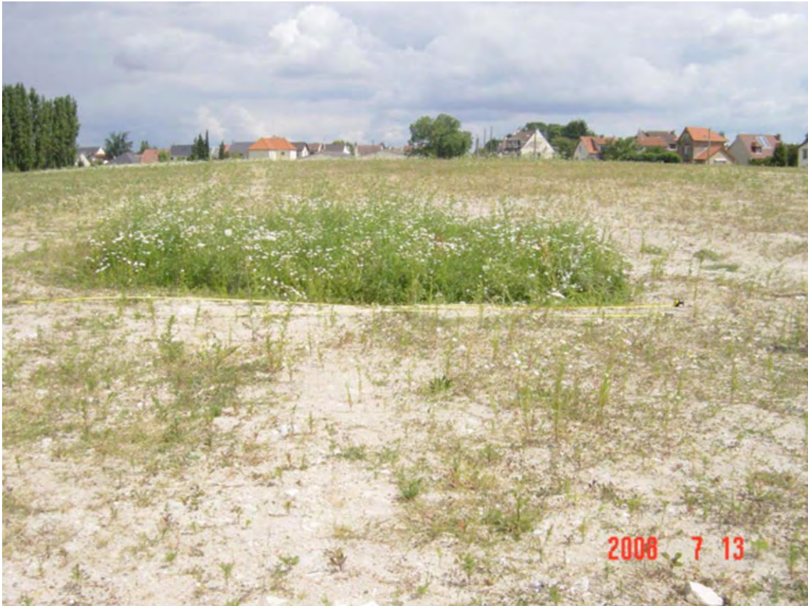
Vue du chemin du bois de l'étoile