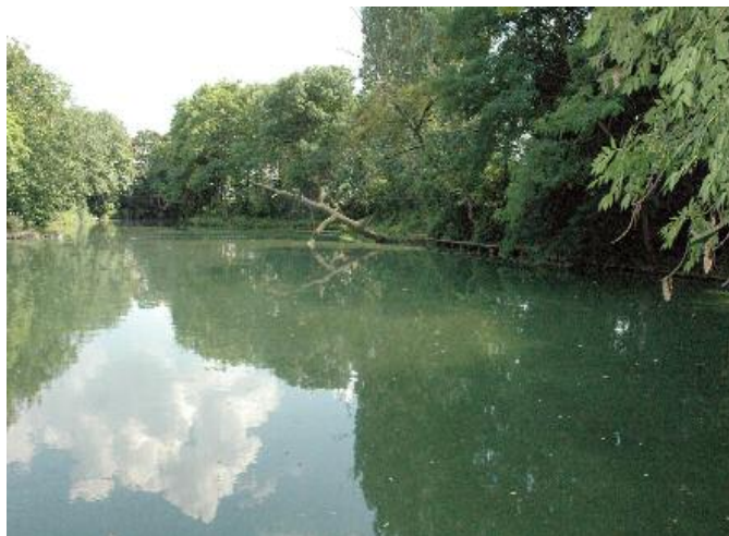
Etang de Maison Rouge