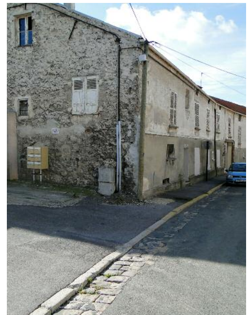
rue Florian: un quartier à réhabiliter