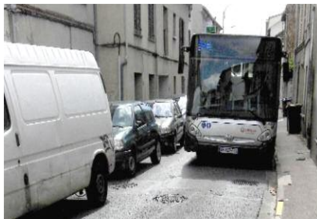
Rue du Général Leclerc