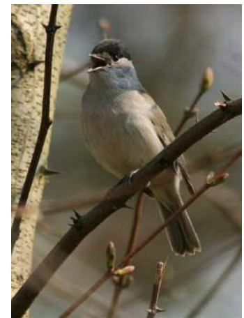
Fauvette à tête noire