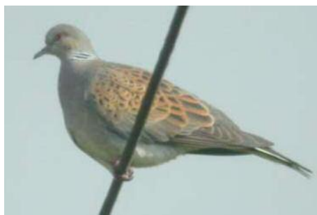
Tourterelle des bois