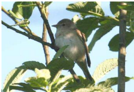
Fauvette des jardins